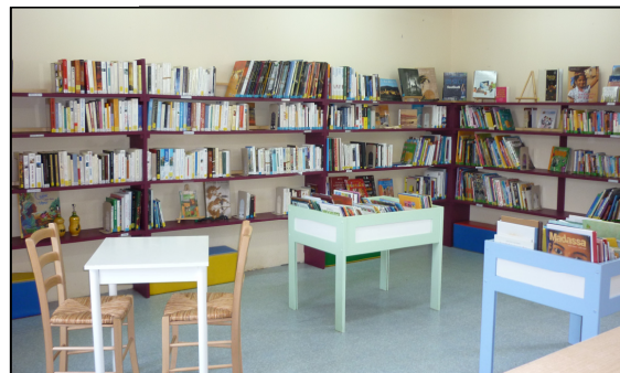
Bibliothèque – route du Fresne/Ingrandes (à côté du centre des loisirs)

N'hésitez pas à pousser la porte, l'équipe de bénévoles sera heureuse de vous guider dans votre choix. L'emprunt des ouvrages est totalement gratuit et plus de 1 000 livres pour adultes et enfants, vous attendent !